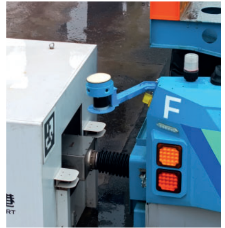
QCC 充电连接器和 ART 处于连接充电状态。

全球首个智慧零碳码头在天津港的成功建立标志着海运物流的重大进步。史陶比尔提供的快速充电连接器解决方案在这一成就中发挥了关键作用,促进了高效、安全和可持续的港口运营。随着天津港在自动化领域不断创新和树立新标准,它已成为全球港口的典范。史陶比尔QCC的实施不仅提高了运营效率,还推动了现代港口管理向更可持续发展的方向转变。有了这些进步,航运业可以展望一个以改善物流、减少环境影响和提高运营韧性为特征的未来。